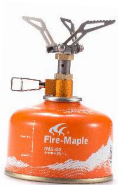
HORNET FMS-300T Портативная титановая горелка