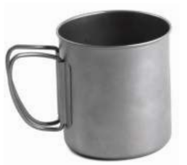
FMP-307 Титановая кружка