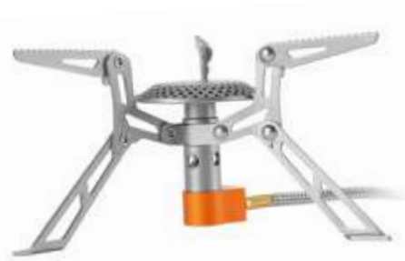
BLADE FMS-117T Портативная титановая горелка