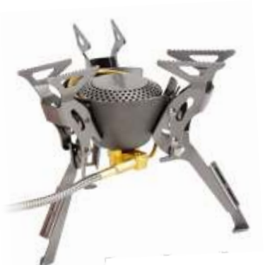
KING KONG FMS-100T Портативная титановая горелка