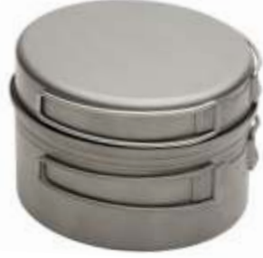
HORIZON 1 Титановый набор посуды