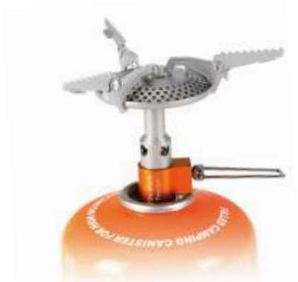
HEAT CORE FMS-116T Портативная титановая горелка